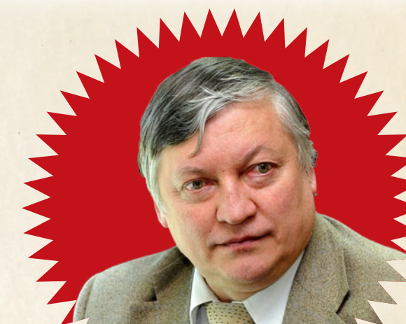
Gość specjalny ANATOLIJ KARPOW Szachowy mistrz świata w latach 1975-1985

Tydzień filmów fabularnych z tematyką szachową. 16-20.08.2020, godz. 21.00 Rynek