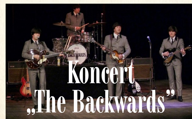
Mistrzowie Świata grają muzykę THE BEATLES 21.08.2020, godz. 19.00 Rynek